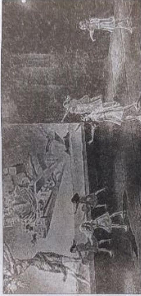
Les élèves de Corps & Graphie retrouvaient le parquet du Théâtre en rond, après plusieurs années d'absence.

french cancan. Hitchcock, Pulp Fiction et même 50 nuances de Grey ont connu des revisites assez majestueuses. Jazz, dancehall, classique, contemporain... toutes les disciplines étaient à l'honneur avec un fil rouge perceptible et appréciable, mettant en avant la femme avec un grand