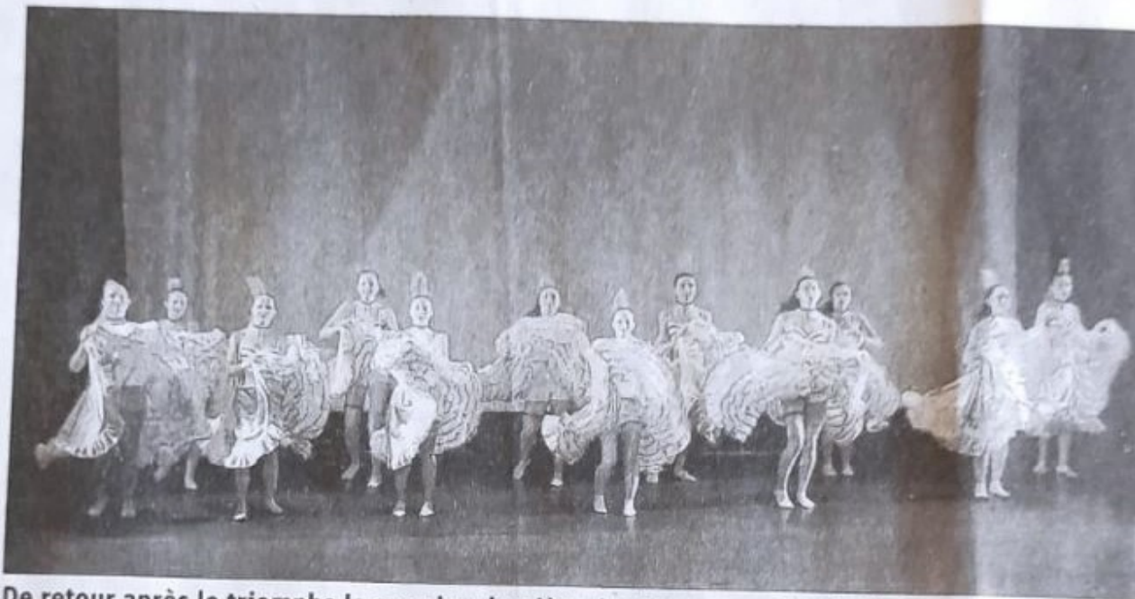
De retour après le triomphe la semaine dernière, les danseuses du Moulin Rouge de Sassenage ont performé à nouveau.